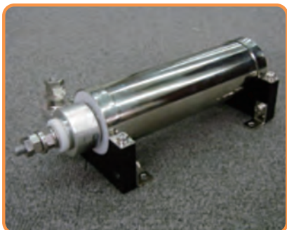
同軸分流器