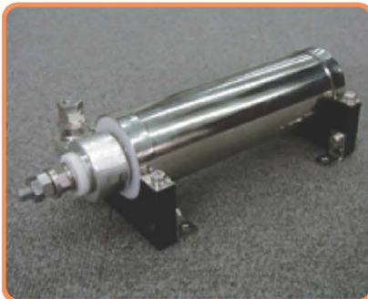
同軸分流器